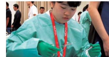
ブラックジャックセミナー